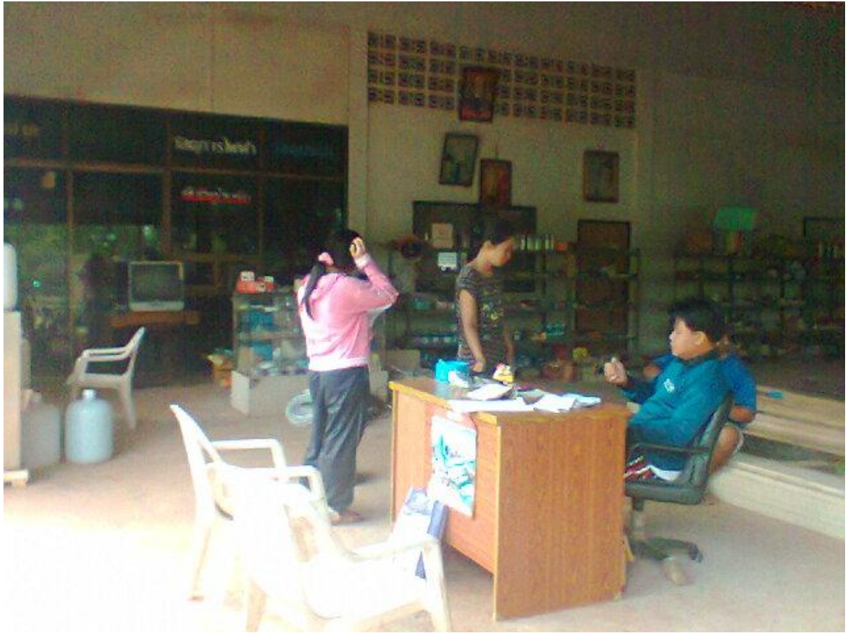
รูปที่ 2 การติดต่อซื้อขาย