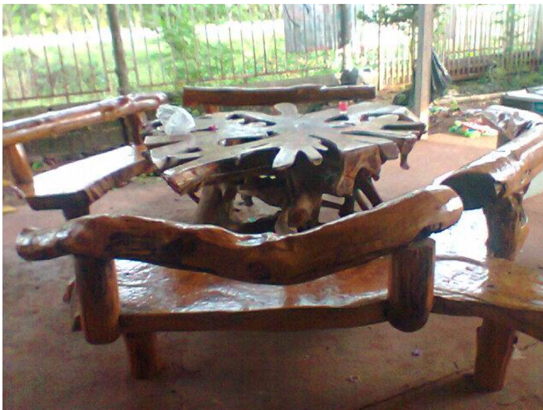
รูปที่ 4 ไม้แปรรูป