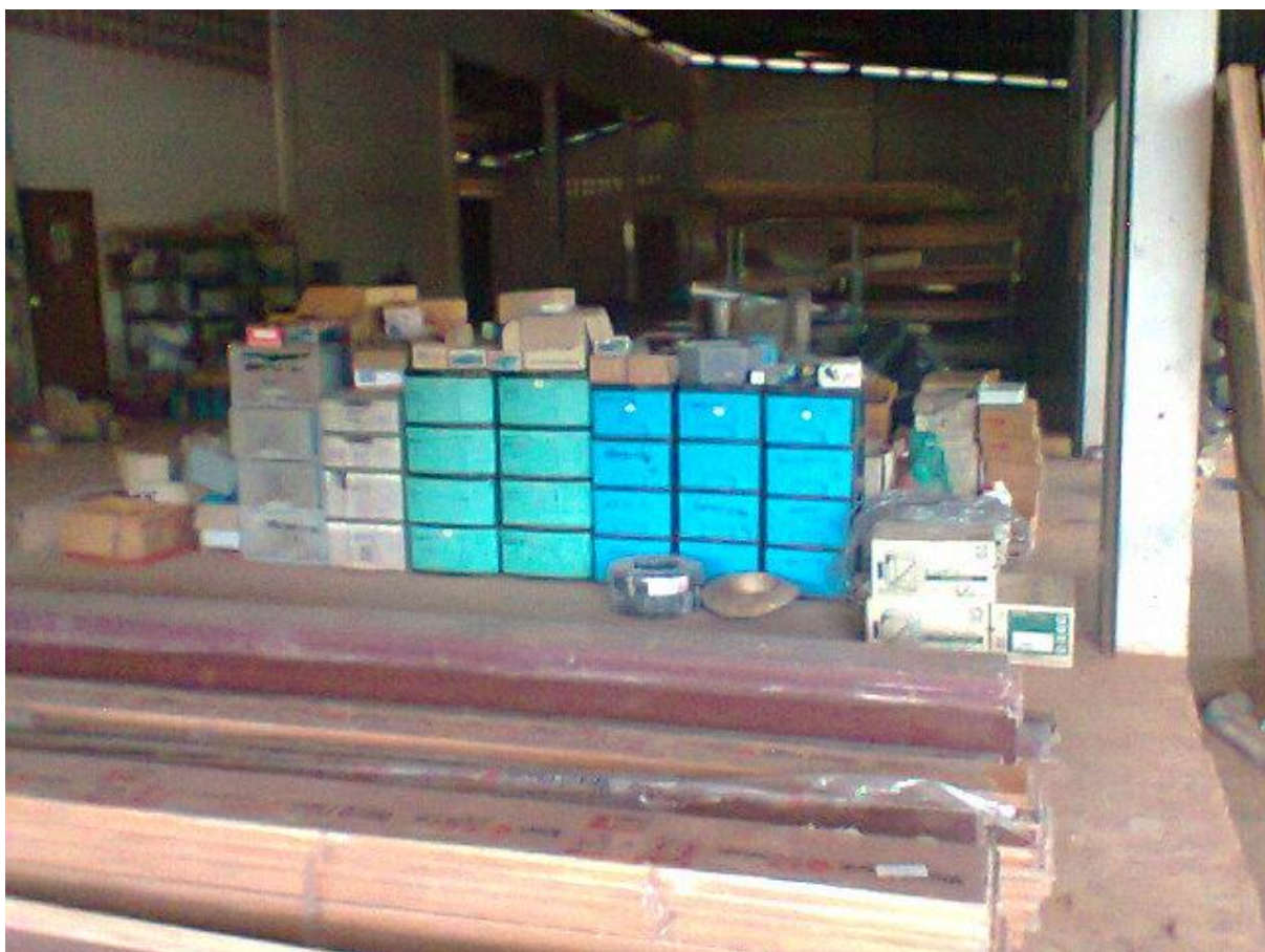
รูปที่ 3 สินค้าในร้าน