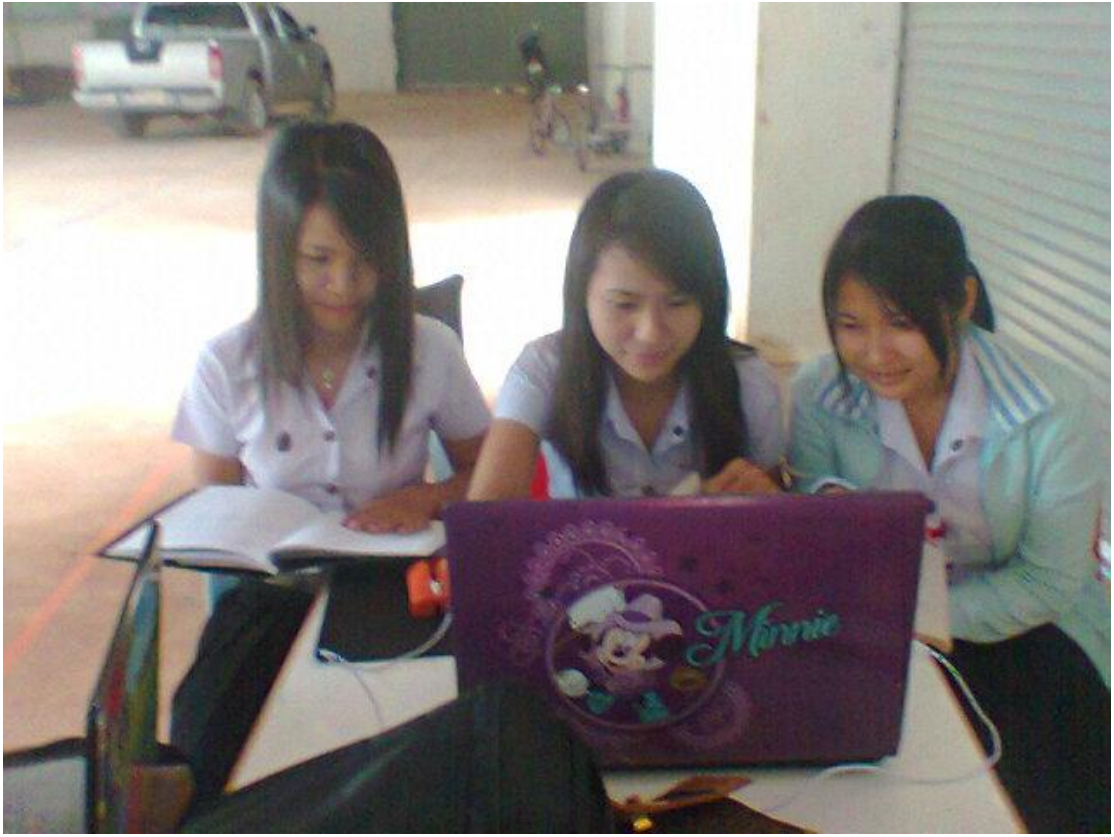
รูปที่ 7 การจัดทำบดูล