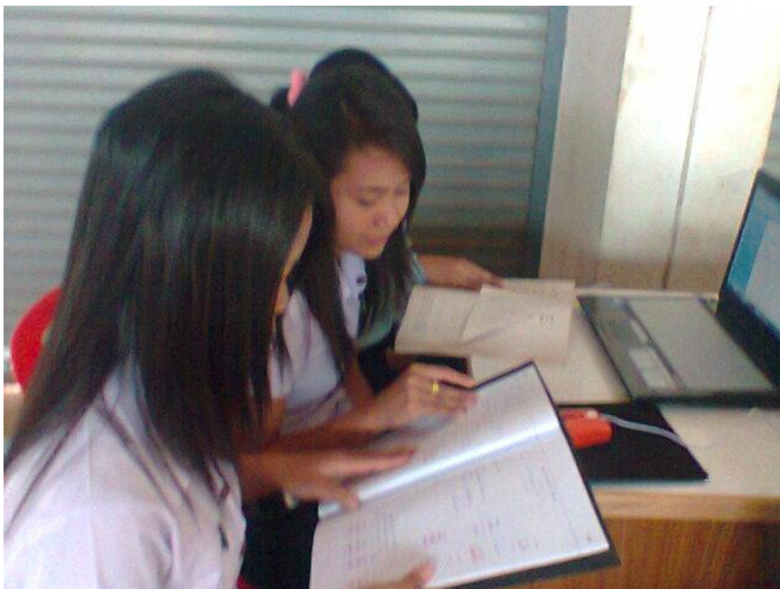
รูปที่ 6 การจัดทำงบกำไรขาดทุน