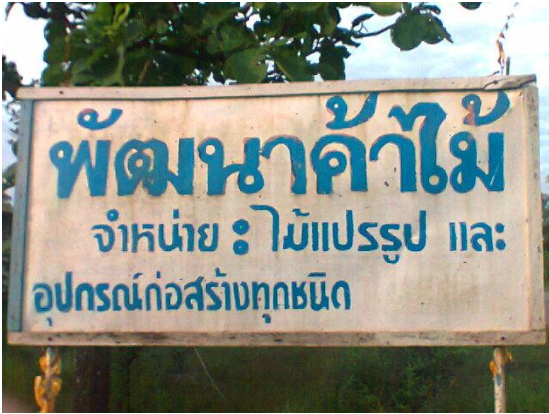
รูปที่ 1 ป้ายร้านพัฒนาค้ำไม้