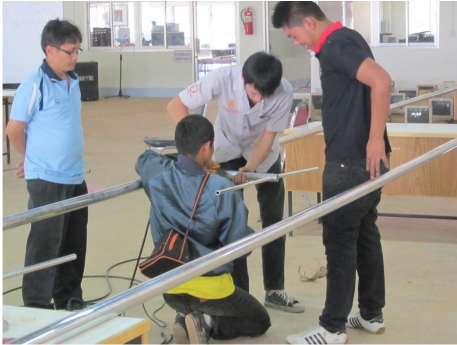
รูปที่ 2 แสดงการประกอบแผงสัญญาณวิทยุระบบ เอฟ เอ็ม คลื่นความถี่ 104 MHz