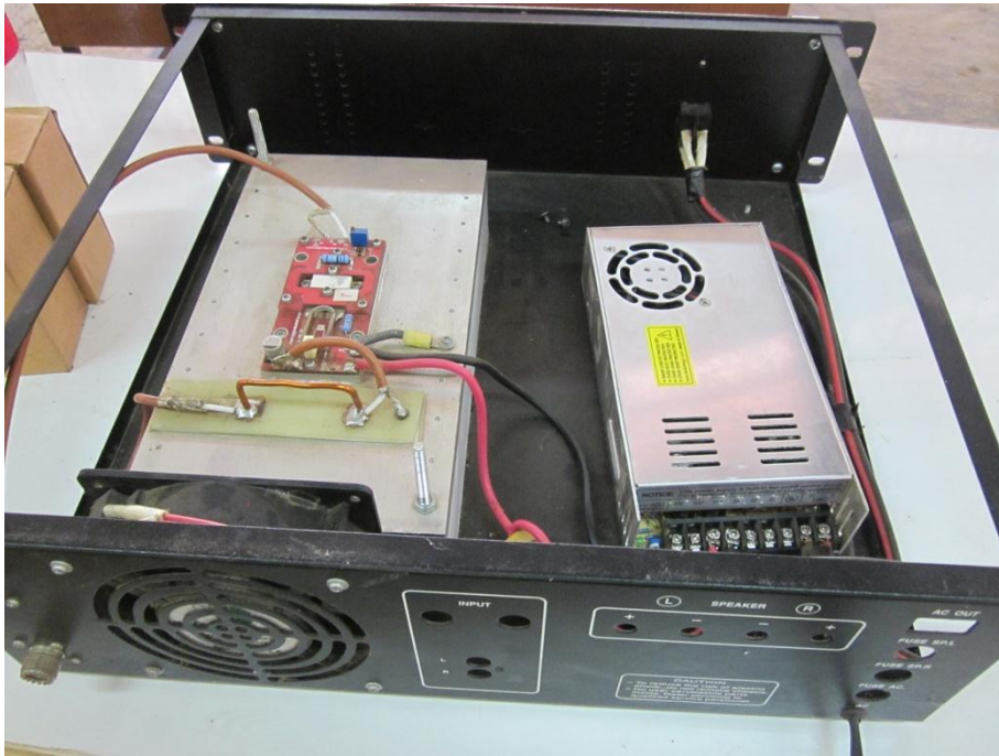
รูปที่ 4 การจัดทำเครื่องส่งสัญญาณวิทยุแบบระบบ เอฟ เอ็ม คลื่นความถี่ 104 MHz