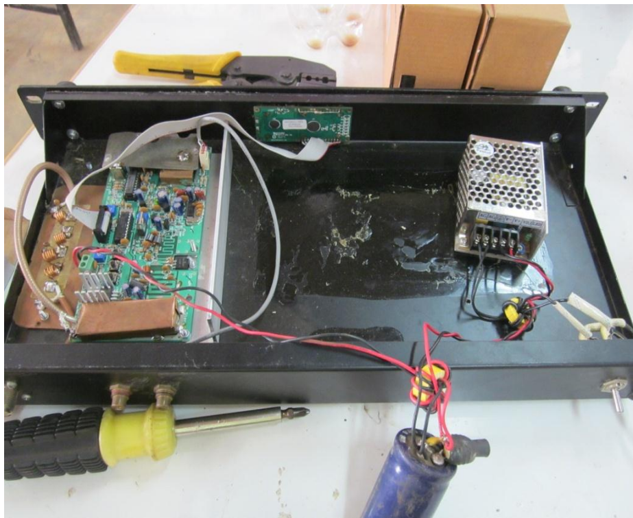
รูปที่ 3 การจัดทำเครื่องส่งสัญญาณวิทยุแบบระบบ เอฟ เอ็ม คลื่นความถี่ 104 MHz