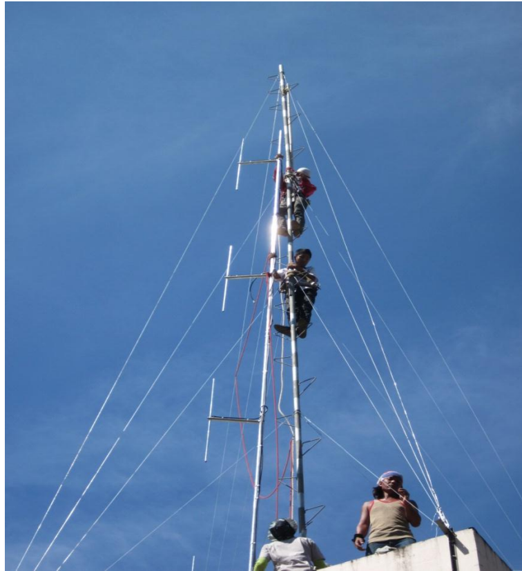
รูปที่ 8 การติดตั้งเสาสถานีวิทยุเพื่อติดตั้งแผงส่งสัญญาณวิทยุแบบระบบ เอฟ เอ็ม