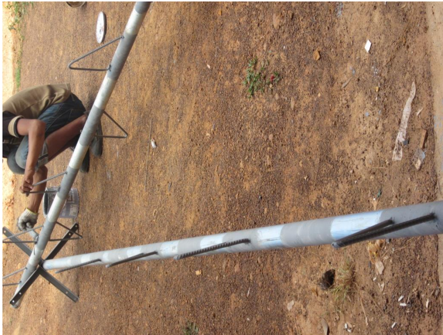
รูปที่ 6 การประกอบเสาสถานีสัญญาณวิทยุเพื่อใช้ในการติดตั้งแผงส่งสัญญาณวิทยุ ระบบ เอฟ