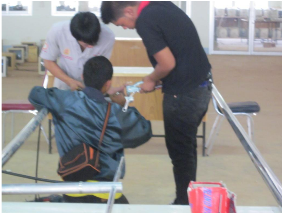
รูปที่ 1 แสดงการประกอบแผงสัญญาณวิทยุระบบ เอฟ เอ็ม คลื่นความถี่ 104 MHz