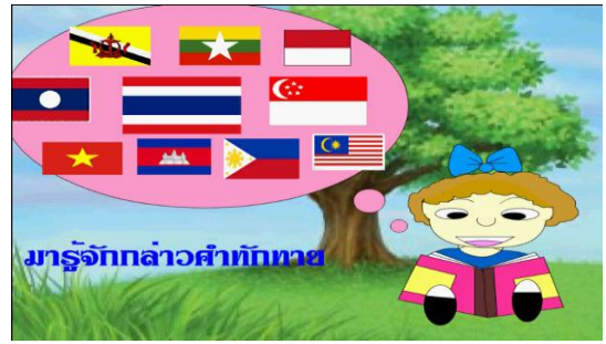
รูป แสดงคำทักทาย

การจัดทำโครงการ การพัฒนาสื่ออิเล็กทรอนิกส์ โดย Adobe Flash CS๓ เรื่อง คำทักทายในภาษาอาเซียนได้ผลการดำเนินโครงการ คือ