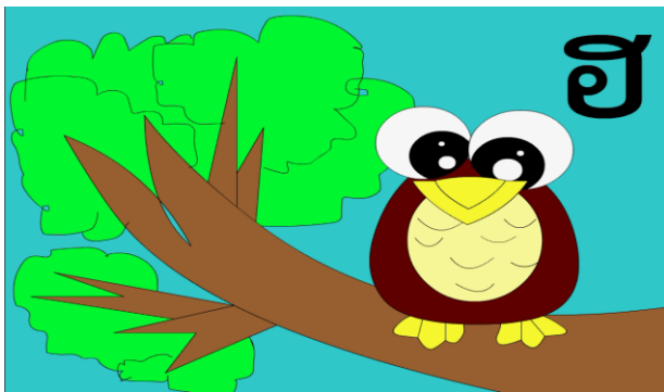
แสดงพยัญชนะไทย ฮ ประกอบภาพเคลื่อนไหว